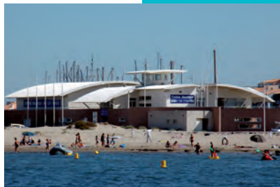
Le Centre Nautique