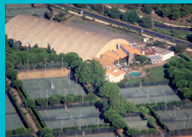
Centre International de Tennis