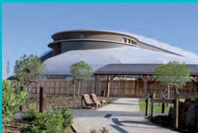
Archipel, la cité de l'eau