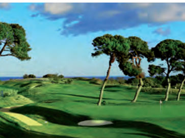
Le Golf du Cap d'Agde

C'est donc dans ce contexte et avec grand plaisir que nous accueillerons les Journées d'Etude Nationales de l'ANDIISS. Je souhaite à tous les participants bien sûr la bienvenue à Agde, mais surtout un excellent travail de concertation et d'échanges d'expériences qui ne peuvent être que profitables à l'évolution du sport.